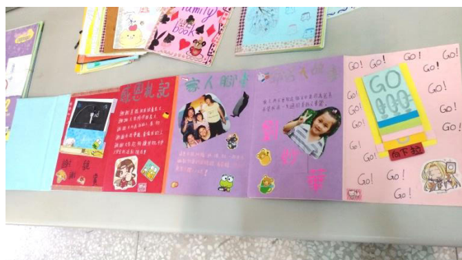
家庭小書-學生用心設計發揮美編與創意