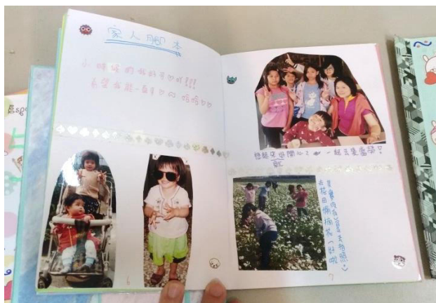
家庭小書-學生記錄生活點滴