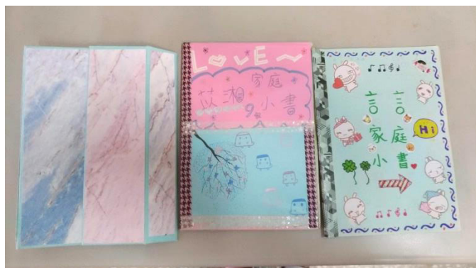
家庭小書-學生用心設計發揮美編與創意