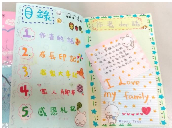
家庭小書-目錄與想說的話