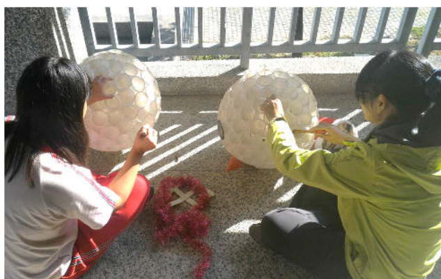
在製作聖誕活動用材料中與學生晤談，關心其生活狀況