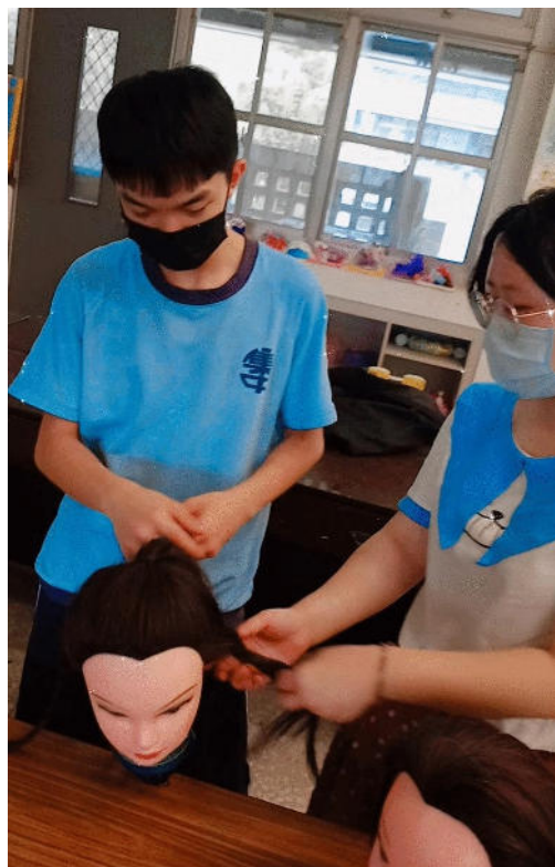
高關懷個案職業體驗