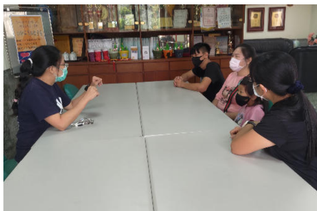
高關懷學生慈輝班參觀