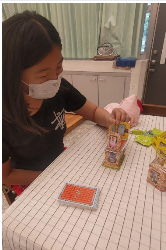
以桌遊與學生探討人際合作