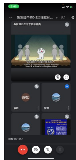
家庭教育資訊素養