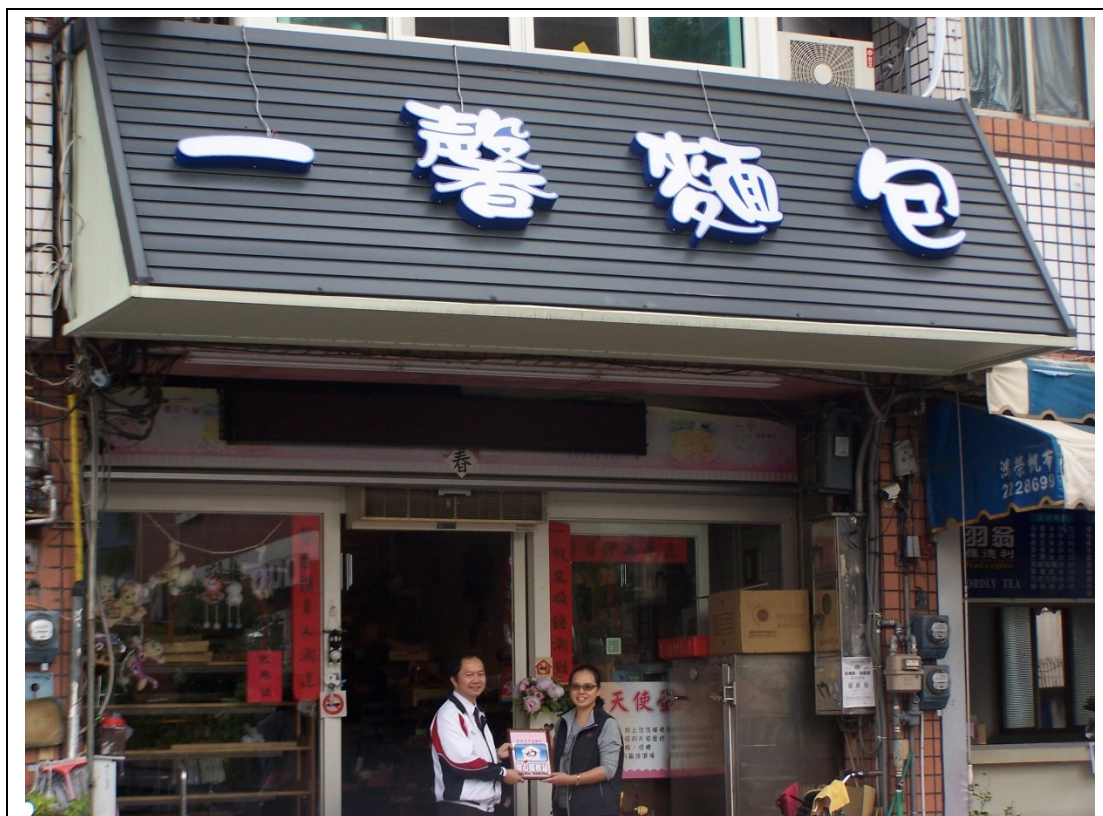
本校合作之愛心商店