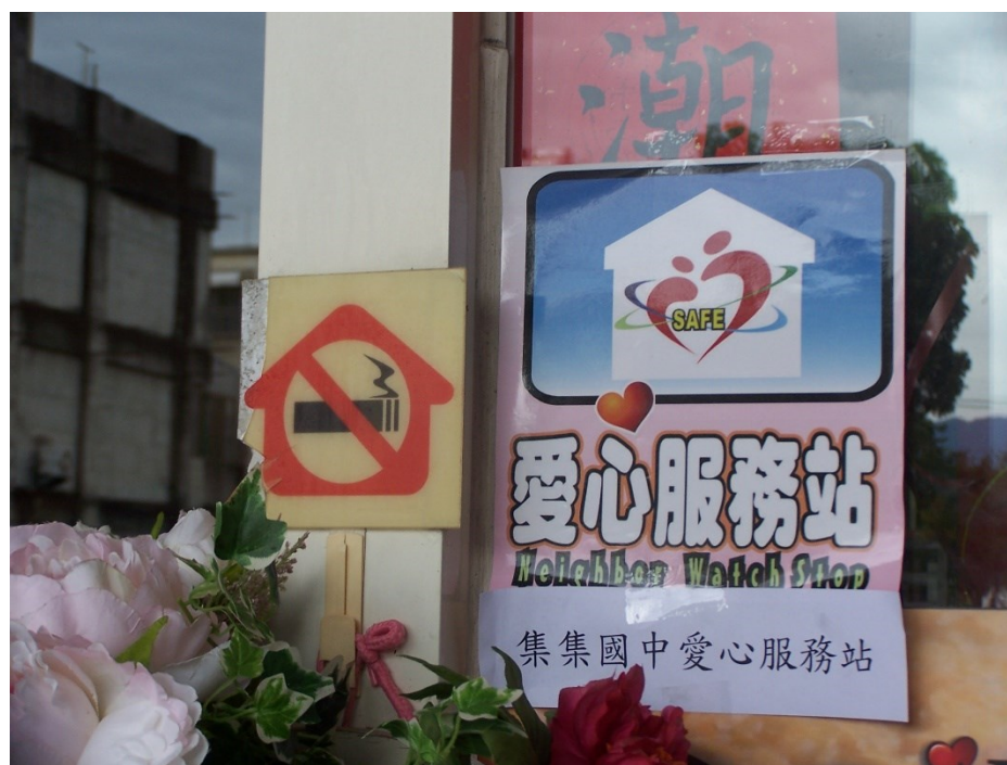
本校之愛心服務站