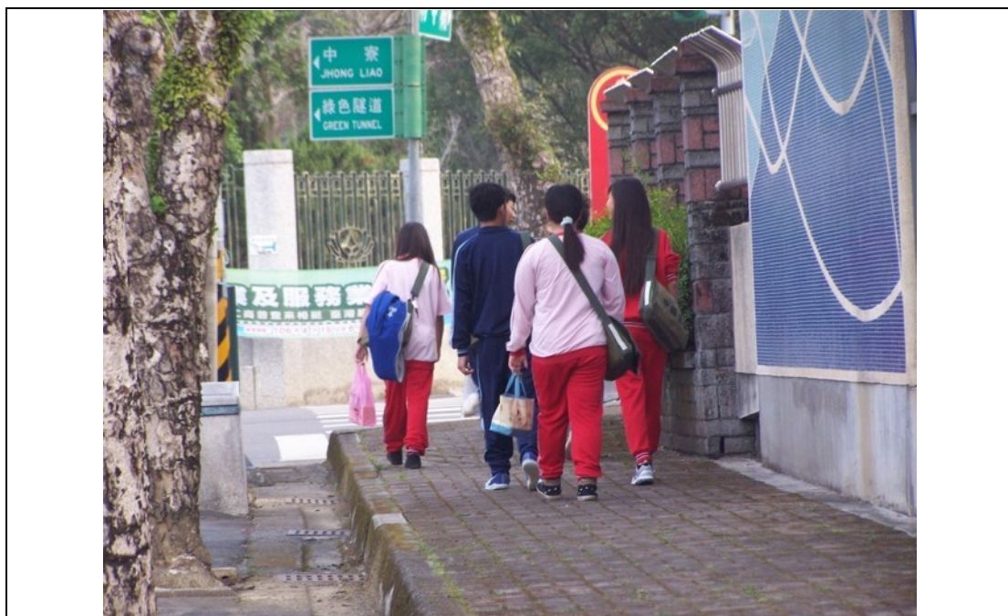
放學路隊鼓勵步行