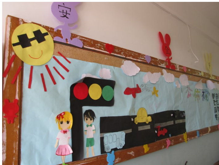
說明：教室環境佈置融入交通議題