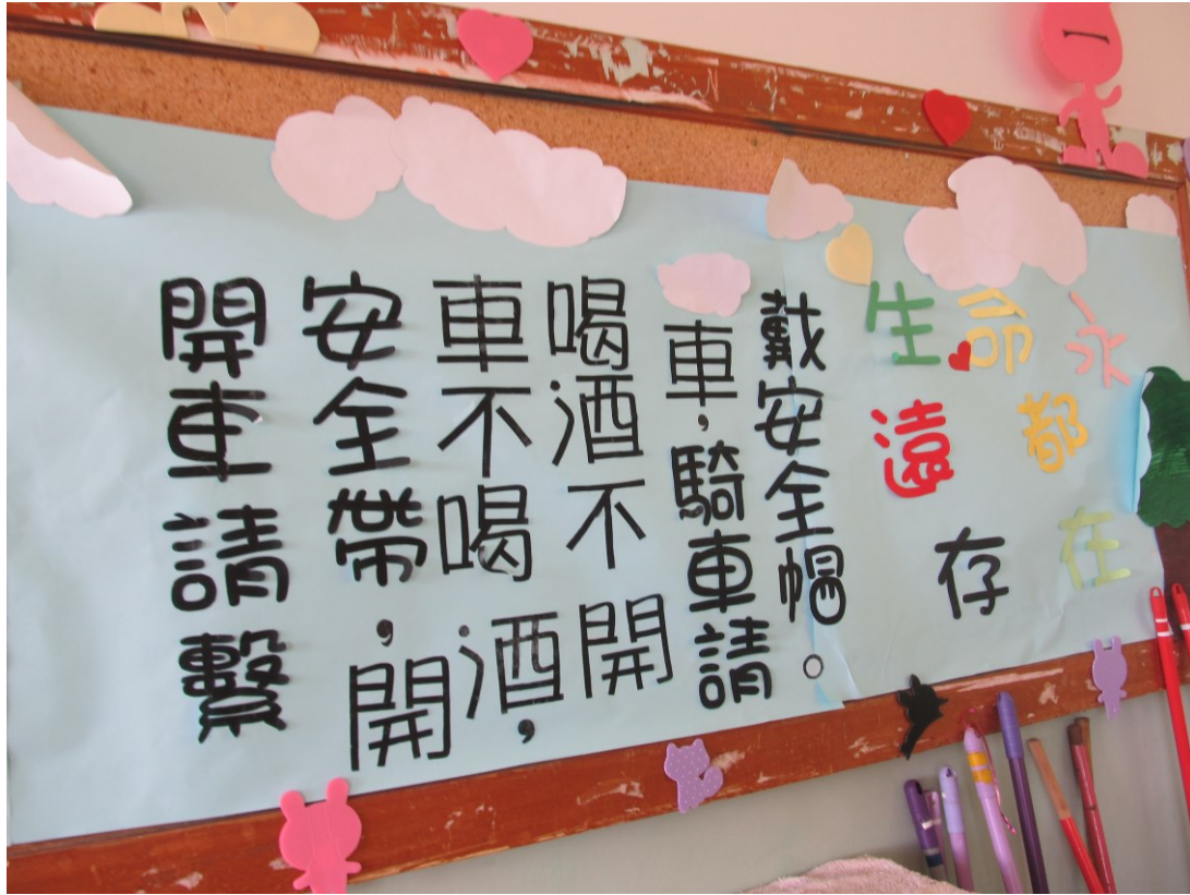
說明：教室環境佈置融入交通議題