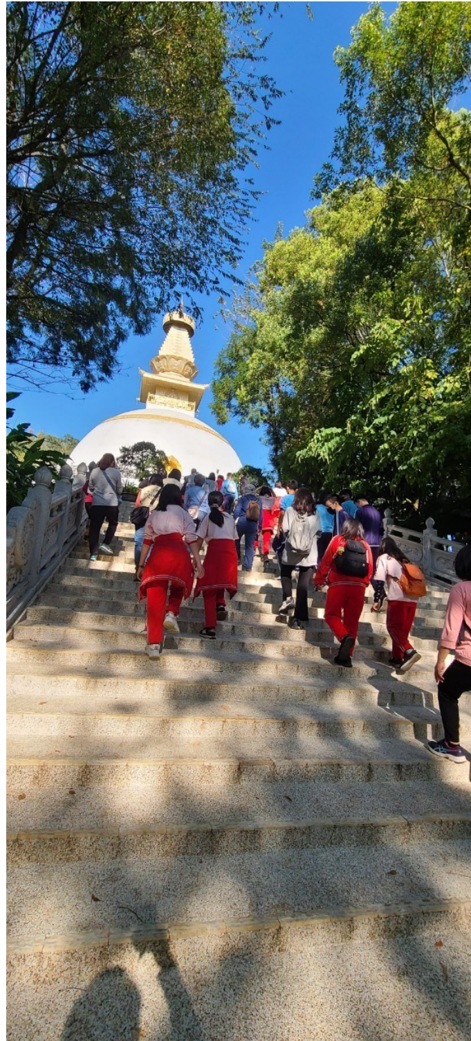
說明:全校師生歷經 5.6 公里的步行，安全抵達鎮國寺